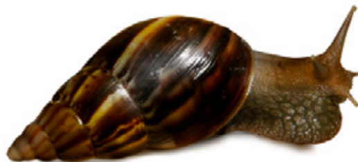
Achatina fulica . "Caracol Gigante Africano".

Devora cultivos y jardines, además de ser un foco transmisor de parásitos que afectan a la salud humana.